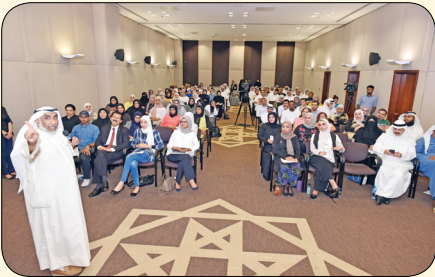
التنمية البشرية .. الإنسان أولاً