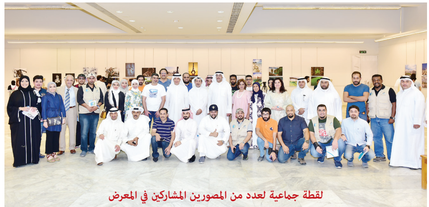
لقطة جماعية لعدد من المصورين المشاركين في المعرض

المصور الصغير الصقبي يستحق الإشادة للقطاته وأعماله الفوتوغرافية التي ترهن على خلق وابتكار جيل جديد من المصورين الفوتوغرافيين الكويتيين الذين لا يزالون يقدمون فنون العدسة بإبداع واقتدار تميزت بهما أعمالهم المصورة، والتي حازت إعجاب الحضور في المعرض، فضلا على الإقبال الذي فاق التوقعات، ممثلا في حضور شريحة كبيرة من محبي الفنون، وأثبت عالم التصوير الفوتوغرافي بالتالي أنه يوازي فنون التشكيل أهمية، بل في أحيان كثيرة يتفوق ويصبح ذا أهمية كبيرة.