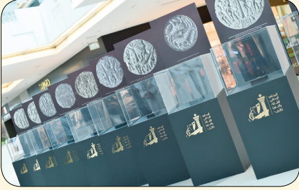
الأختام الدلمونية .. إرث حضاري متميز