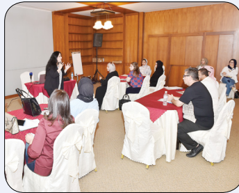
ورشة الكتابة النقدية

وكما هو ديدن مهرجان صيفي ثقافي دائماً، جاءت الأنشطة المختلفة لملء أوقات العطلة الصيفية بأنشطة مفيدة للجميع تحرض على التزود بالمعرفة بشتى روافدها.