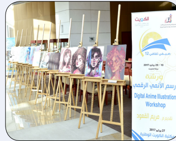
ورشة الأنمي الرقمي