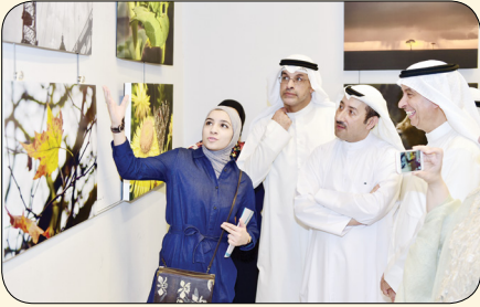
إداعات 60 مصوراً كويتياً