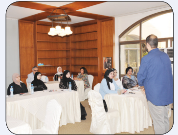
ورشة مهارات سينمائية